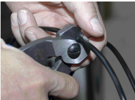
1. Jarruletkujen katkaisuun kannattaa käyttää kunnollisia leikkureita (käytännössä vaijerin-katkaisupihdit), jolloin päistä tulee heti siistit ja suorat.

Ennen ilmauksen aloittamista varmistu käytetäänkö jarrussa öljyä vai DOT-jarrunestettä. Jos DOT:in tilalle menee öljyä se ei ole vielä vaarallista, mutta DOT-jarruneste voi tuhota öljylle tarkoitetun jarrukumiset tiivistet. Käytetty neste on yleensä kerrottu kahvan nestesäiliön kannessa. Jotkut homman ensimmäistä kertaa, ota jarrupalat pois satuloista varmuuden vuoksi, niir et ainakaan onnistu pilaamaan jarrunestettä/öljyllä jarrupaloja.