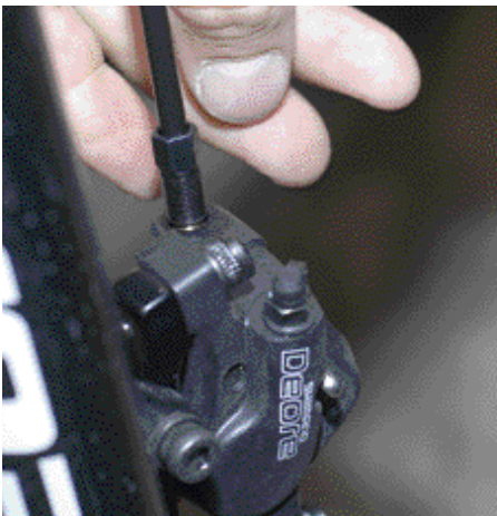
4. Letku työnnetään jarrusatulan reikään ja kiristetään paikalleen. Varmistu oikeasta kiristysmomentista!