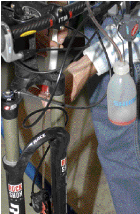
10. Jos käytetään Shimanon omaa ilmaustyökälua, se asennetaan jarrunestesäiliön päälle ja alhaalta painetaan avattuun ilmausruuviin kiinnityllä letkulla varustetulla ruiskulla öljyä sisään. Kun ylhäällä olevassa letkussa ei näy enää kuplia, ilmaus on suoritettu onnistuneesti.