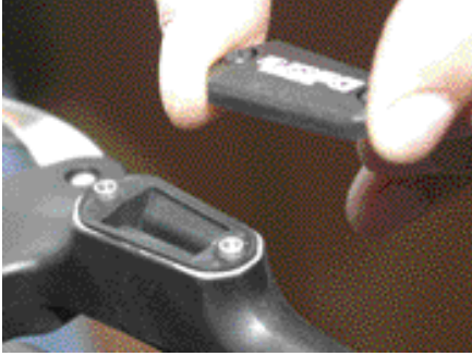
7. Öljysäiliön kannen ruuvit avataan ja kansi irroitetaan. Kun kansi on irti, alta paljastuu kuminen tiiviste, joka estää ilman pääsyn jarrunesteeseen.