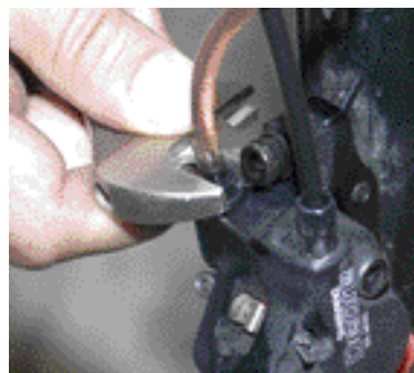
11. Kun ilmausruuvia avataan tai suljetaan, kannattaa öljyä täynnä oleva letku pitää siinä kiinni. Näin ilmaa ei pääse liivahtamaan öljyn joukkoon.