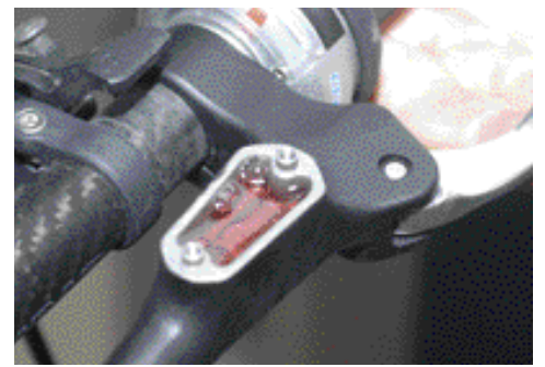
12. Jos ilmaus tehdään kotikonstein, eli käytössä ei ole Shimanon ilmaustyökälua, voidaan toisella ruiskulla imeä varovasti ylimääräinen öljy talteen ennen kuin se löytää tiensä jarrupalloille ja levyille.