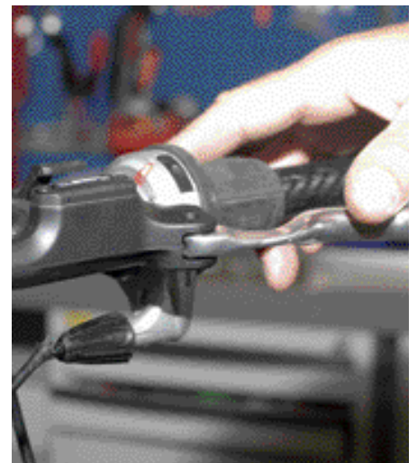
6. Kun letkut ovat paikallaan ja kahva tangossakiinni, kahva käännetään vaakatasoon.