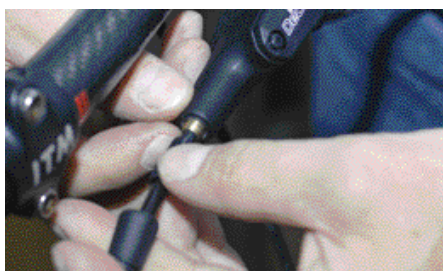
5. Jarrukahvan päässä letku työnnetään paikalleen ja kiristetään tiiviiksi. Viimeiseksi laitetaan muovinen suojus kiristimen päälle.