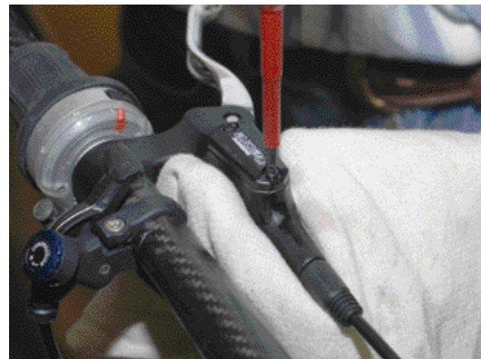
13. Seuraavana on vuorossa systeemin sulkeminen. Ensin asetellaan kumitiiviste paikalleen, sitten kohdistetaan kansi oikeaan paikkaan ja lopuksi kiristetään ruuvit. Käteen kannattaa varata rästi, ettei ylitsevuotava jarruneste sotke paikkoja.

Huom: Shimano ohjeistaa jarrujen ilmaamisen yläkautta, mutta tämä johtunee vain siitä ettei pakkauksessa ole mukana ruiskuja tai letkuja. Alakautta ilmaaminen on kuitenkin paljon helpompaa.