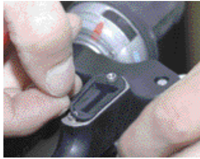
8. Tiiviste nostetaan varovasti pois säiliöstä.