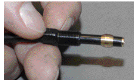
3. Tämän jälkeen letkuun pujotetaan letkun kiristysholkki (vas. musta) sekä helmi (kesk. messinkiä). Päätykappale näkyy letkun päässä oikealla.