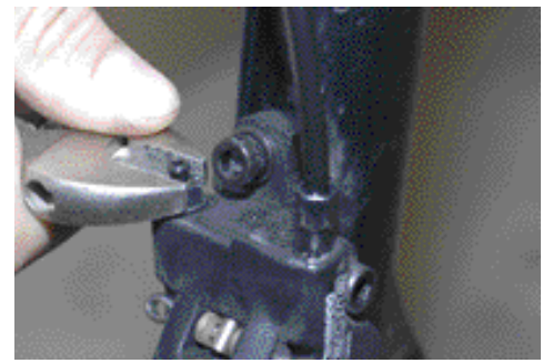
9. Jarrusatulan ilmausruuvi kierretään auki niin että ilma pääsee poistumaan satulasta. Jarrupalat kannattaa ottaa pois ilmauksen ajaksi, sillä palloille joutuva jarruneste pilaa yleensä palat aika tehokkaasti.