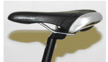
Satulaa voi säätää pituussuunnassa muutaman sentin. Jos satula on kiinni aivan kiskojen päissä, sen kestävyys on kovilla. Satulat on suunniteltu istumaan takapuoleen parhaiten vaakatasossa. Älä siis nosta tai laske nokkaa kuin aavistuksen.