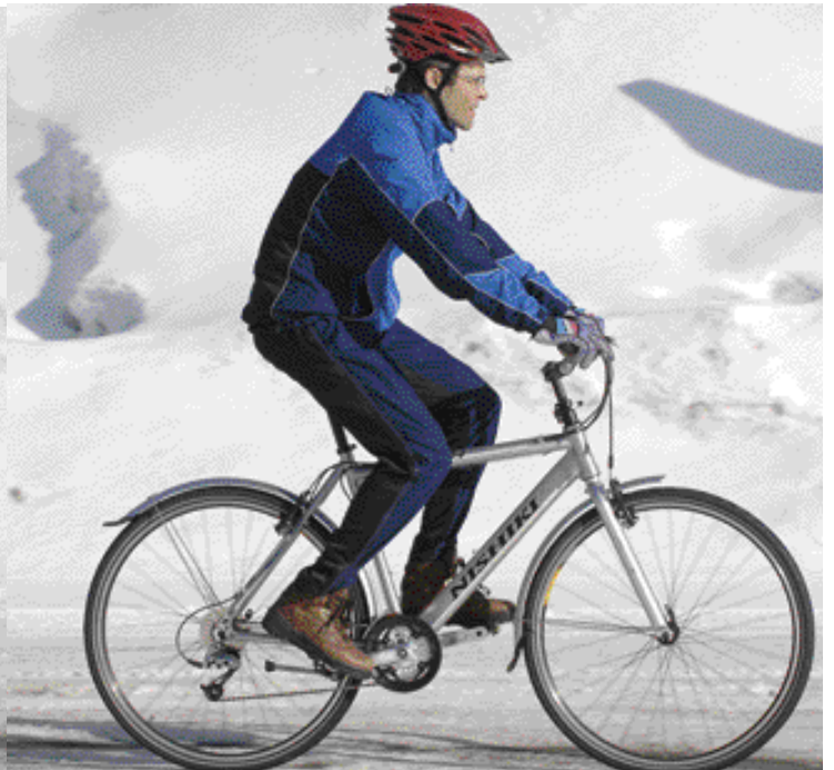
Sama pyörä ja kaksi täysin erilaista ajoasentoa. Ensimmäisessä osa painosta lepää myös käsillä ja takapuolelle tulee vähemmän painetta. Asento on myös jonkin verran aerodynaaminen, joten se soveltuu hiukan kovempaankin menoon. Toisessa kuvassa ohjainkannatin on pystympi ja korkeammalla, jolloin kuski istuu ryhdikkään pystyssä ja tuulen armoilla. Kaikki paino lepää satulalla. Asiantunteva pyöräkauppias osaa kannatinta vaihtamalla ja säätämällä räätälöimään ajoasentoa mieleiseksi, kunhan rungon koko vain on sopiva.