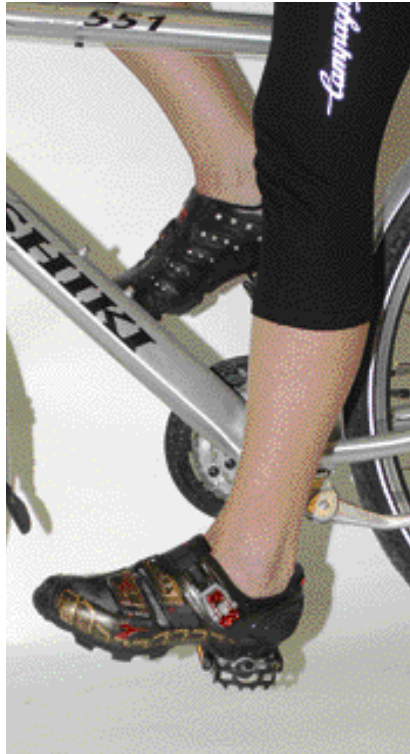
Korkeus on kohdallaan, kun voit polkea kantapäät polkimilla ja lantio ei keinu samalla polven pitää kammen ala-asennossa ojentautua suoraksi.

Kun sopivan kokoinen runko on löytynyt, niin hienosäätöä jatketaan satulasta. Korkeuden lisäksi yhtä tärkeää on satulan oikea kulma ja etäisyys keskiöstä. Sivusta katsottuna satula pitää olla aina lähes vaaterissa. Nokkaa kannattaa yleensä nostaa tai laskea korkeintaan aste tai kaksi, eli todella vä-