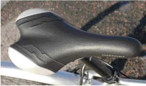
Tämä satula sopii jo paremmin vauhdikkaalle kuljettajalle ja ajoasentoon, jossa osa painosta lepää käsillä ja ylävartalolla. Paljon ajavat suosivat melko minimalistisia satuloita, joihin takapuoli tottuu muutaman ajokerran jälkeen vaikka aluksi muulta tuntuisikin.

hän. Nokka pystyssä ajaja liukuu taakse ja istuminen onnistuu vain yhdessä kohdassa. Nokka alhaalla takapuoli liukuu väkisin eteen ja ilmiötä pitää vastustaa käsillä, jolloin ylävartalo väsyä. Tässäkin tilanteessa satulassa ei voi yleensä istua kuin yhdessä kohdassa.