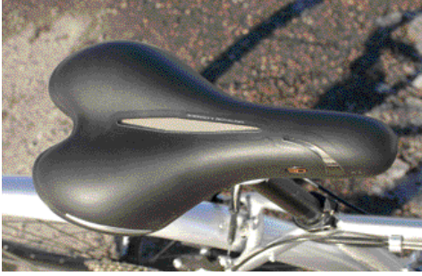
Kuvan Lookin -satula on hyvin pehmustettu ja se sopii ajajalle, jonka ajoasento on pysty ja ajelu on enimmäkseen rauhallista ja matkat lyhyitä.